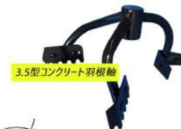
3.5型コンクリート羽根軸