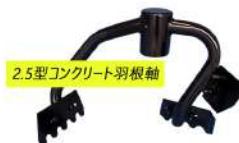
2.5型コンクリート羽根軸